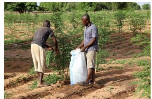
Photo : Appui à l'amélioration des conditions de production et de commercialisation du moringa.