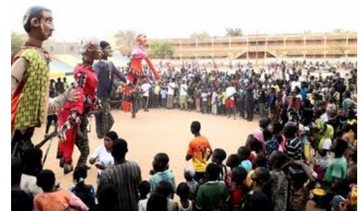
Photo : Spectacle amitié, solidarité et diversité à Mopti